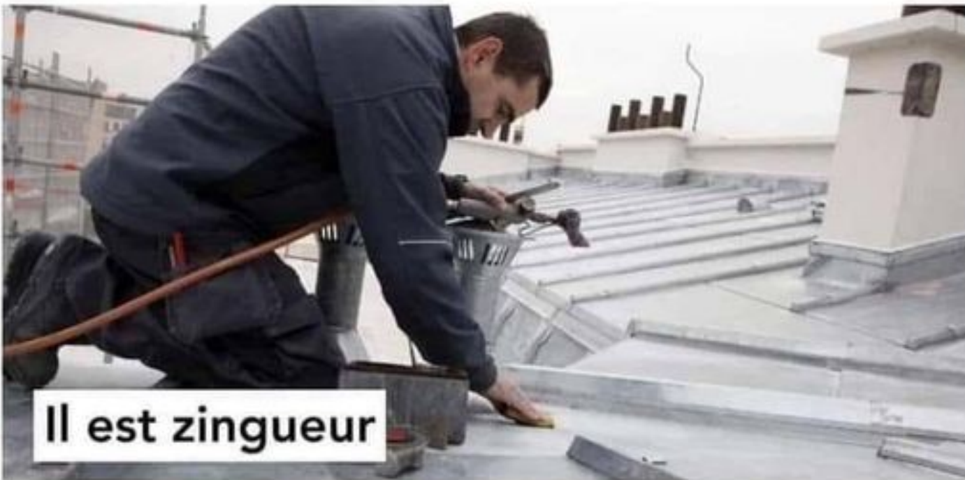
Il est zingueur